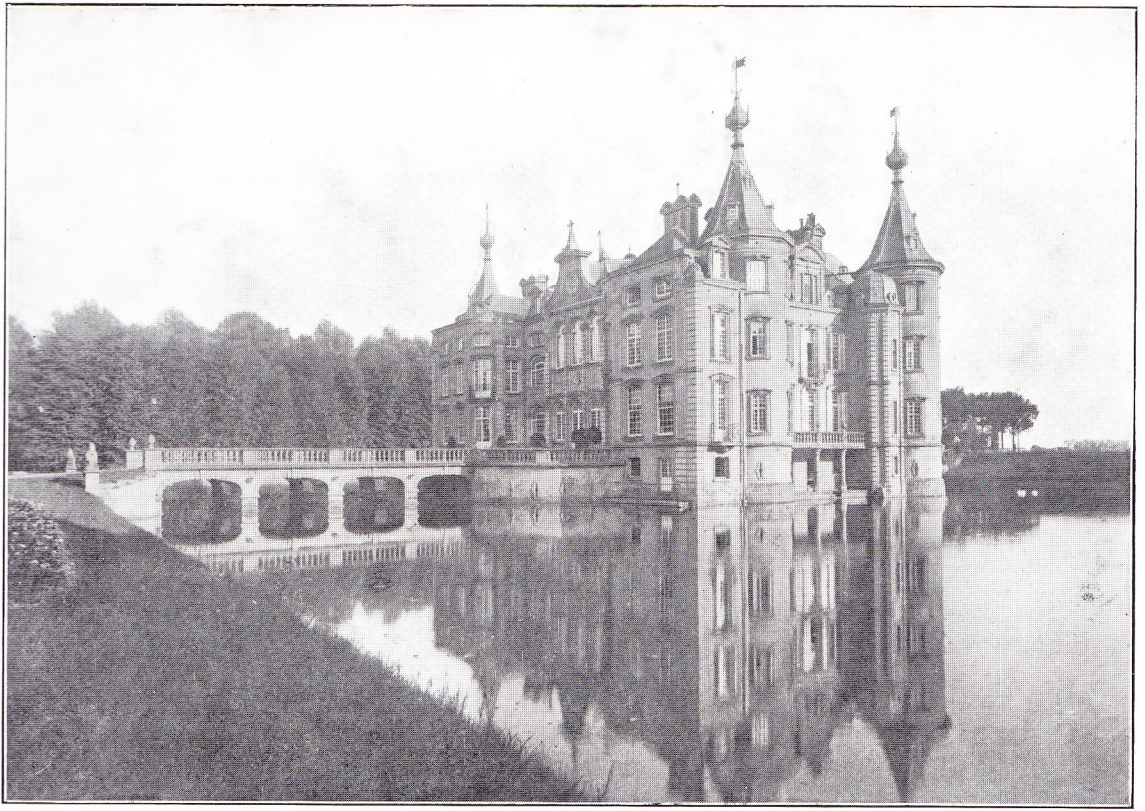
205. — CHATEAU DE POUQUES (FLANDRE ORIENTALE). Vue d'ensemble.